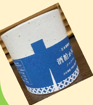
【おつまみ イメージ写真】