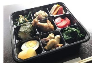
【お弁当 イメージ写真】

お酒(720ml)1本(蔵元、銘柄等は選べません)、 お弁当、おつまみ、駐車場(オーパ提携駐車場(2時間以内))