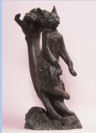
朝倉文夫《吊された猫》(1909年) 大分県立美術館蔵

朝倉文夫生誕140周年記念 猫と巡る140年、そして現在 会期: 6月9日(金)~8月15日(火) 大分県立美術館 1階 展示室A・アトリウム