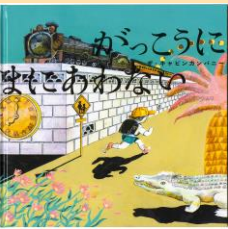
絵本「かっこうにまもどあわなない」 2022年 (あかね書房)