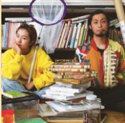
ザ・キャビンカンパニー