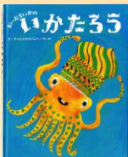
絵本「だいういかのいかたろう」 2014年 (鈴木出版)

6月11日(日) お支払い金額 大人 6,800円 高校・大学生 6,000円 中学生以下 5,200円 (※全国旅行支援対象) 7月15日(土) 地域クーポン 1,000円分付 (6/11, 7/15), 8月4日(金) 地域クーポン 2,000円分付 (8/4) (旅行代金 大人 8,500円 高校・大学生 7,500円 中学生以下 6,500円)