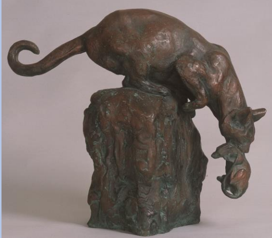
朝倉文夫《よく獲たり》(1946年)大分県立美術館蔵

朝倉文夫生誕140周年記念 猫と巡る140年、そして現在 会期: 6月9日(金)~8月15日(火) 大分県立美術館 1階 展示室A・アトリウム